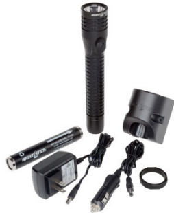
Items in the box - Articles dans la boîte - Elementos de la caja

Thank you for selecting this NIGHTSTICK product. Save these instructions. Please read these instructions before using your NIGHTSTICK. It includes important safety and operation information. Be sure to charge the NIGHTSTICK fully before the first use. A battery is fully charged when the charger light is green.