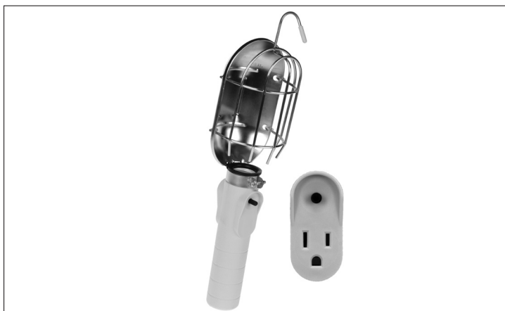
Electrical Rating - All models use 125 Volts 60 HZ

Unplug the reel before replacing the light handle