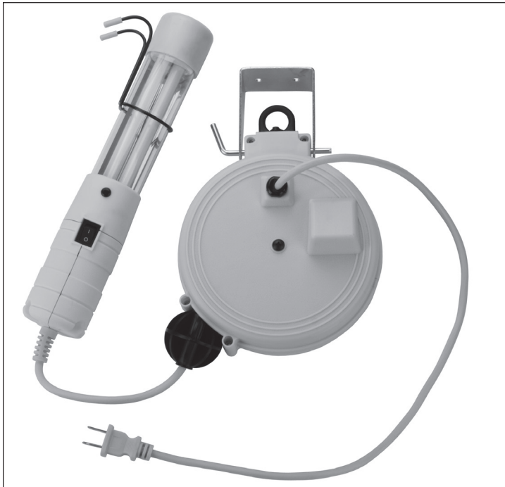
Electrical Rating - All models use 125 Volts 60 HZ

CAUTION - TO REDUCE THE RISK OF ELECTRIC SHOCK AND FIRE - PULL PLUG WHEN SERVICING OR WHEN RE-LAMPING — USE ONLY 13 WATT OR SMALLER BULB.