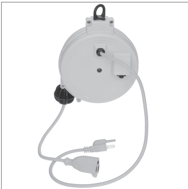
Electrical Rating - All models use 125 Volts 60 HZ

CAUTION - TO REDUCE THE RISK OF ELECTRIC SHOCK AND FIRE - PULL PLUG WHEN SERVICING CONNECTING/DISCONNECTING FROM THE CORD REEL.