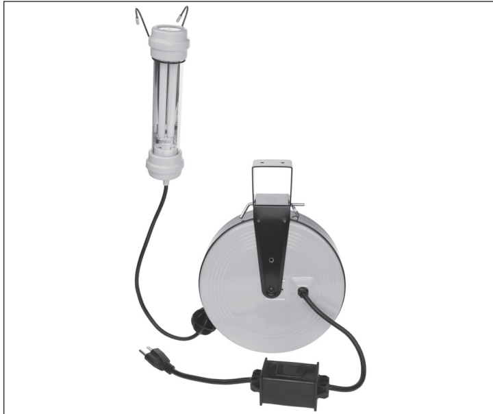
Electrical Rating - All models use 125 Volts 60 Hz

CAUTION - TO REDUCE THE RISK OF ELECTRIC SHOCK AND FIRE - PULL PLUG