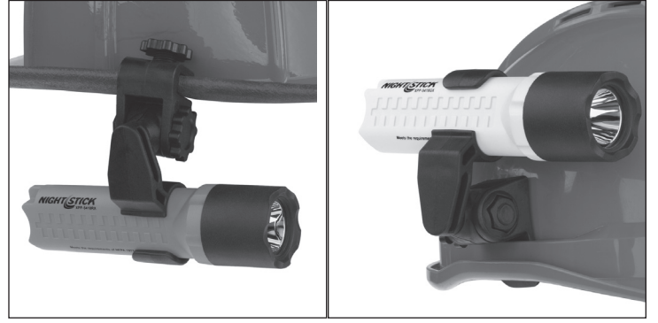
XPP-5418 - Siperlik Montaj Aparatı